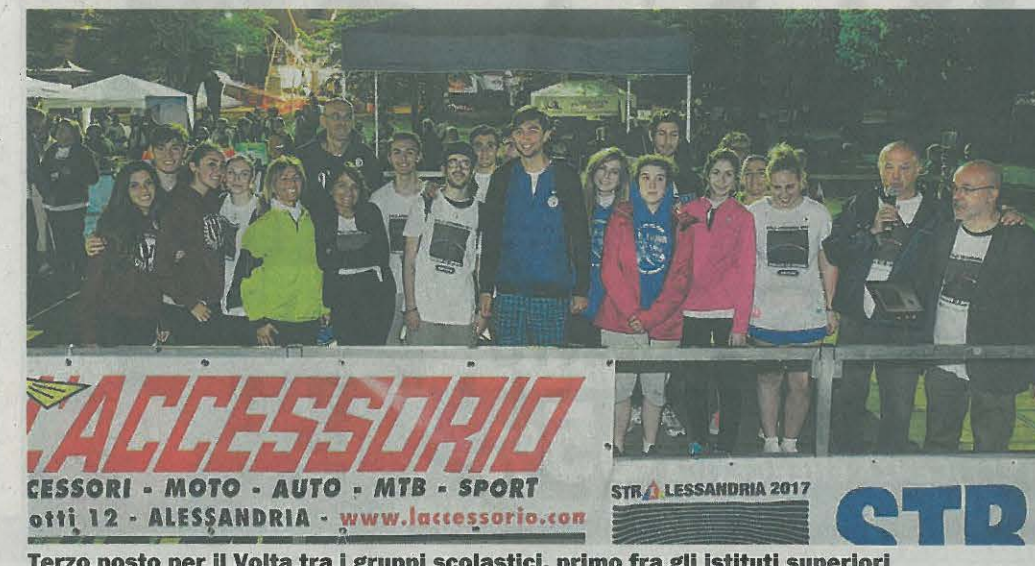
Terzo posto per il Volta tra i gruppi scolastici, primo fra gli istituti superiori